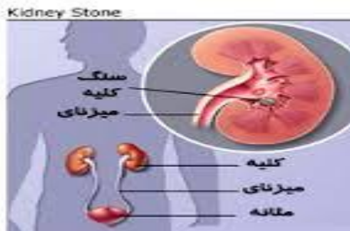
کلینیک آموزش سلامت