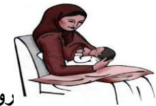
روش گهواره ای متقابل